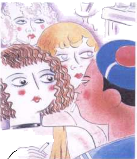
Dessin de Jean Moulin