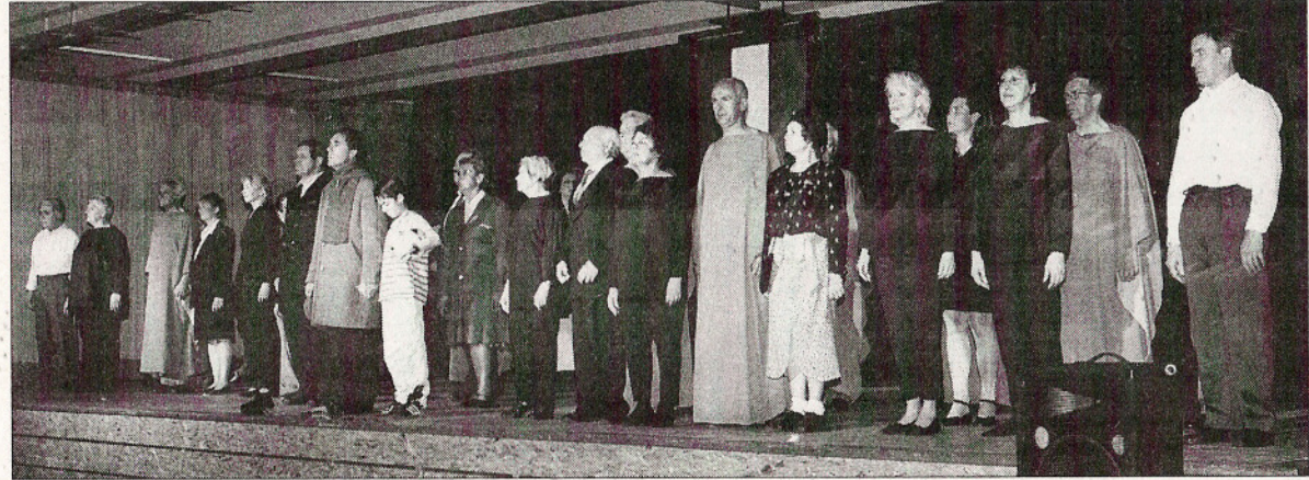
Une première pour Rumilly.

Alors qu'un jeune interrogeait Jean Moulin, on découvrait le quartier avec des mots qui montraient bien l'acteur : rue de la Liberté, rue du courage et enfin la maison où il a vécu.