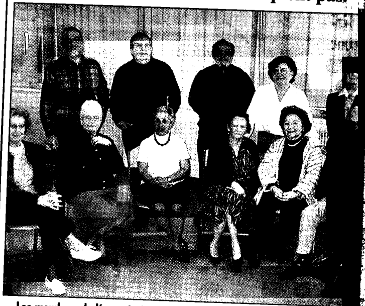
Les membres de l'association s'attachent à faire revivre le passé des Vaudaises et des Vaudais à travers des entretiens filmés.

Les « historiens locaux » de l'association « Mémoires » se sont retrouvés dernièrement pour leur assemblée générale annuelle. Les projets ne manquent pas.