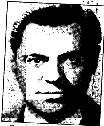
Une pièce de théâtre sur Jean Moulin. Le personnage méritait bien un tel hommage.